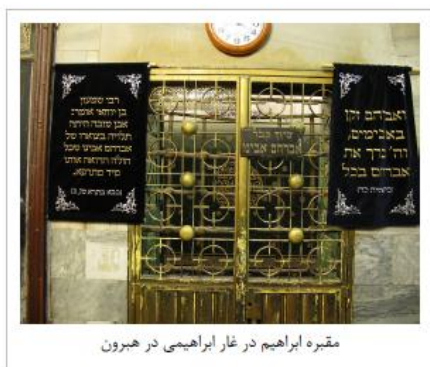
مقبره ابراهیم در غار ابراهیمی در هبرون

مردم که شرمسار شده بودند تصمیم گرفتند او را به درون آتش بیندازند. خدا به آتش دستور داد سرد گردد و برای او بی خطر شود. ابراهیم آسیب ندید؛ ولی مردم همچنان به اذیت او ادامه دادند.