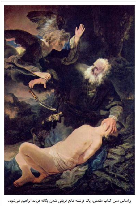
براساس متن کتاب مقدس، یک فرشته مانع قربانی شدن یگانه فرزند ابراهیم می‌شود.

زمین نهاد و به دنبال آب شتافت. ولی هرکجا می دوید، بجای آب سراب بود. پیش رو سراب، پشت سر