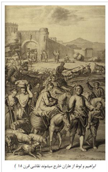
ابراهیم و لوط از هاران خارج میشوند نقاشی قرن ۱۸

حضرت ابراهیم دارای عمری دراز و زندگی بسیار پرماجرا بود؛ که به صورت مختصر در چند بخش آتی به آنها می‌پردازیم.